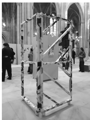
Exposition Itérations de Descamps+Mazzi, coproduction Ville de Metz / Maison de l'architecture de Lorraine, 2023