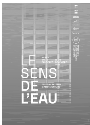
Affiche du FFA 23© Philippe Tytgat