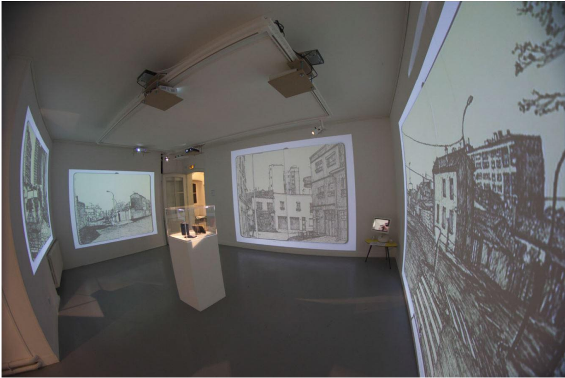
Vue de l'entrée de la Galerie

Photos de la galerie Raymond Bannas (expo Mehdi Zannad, 2013) :