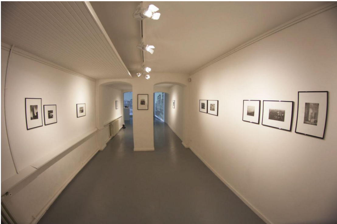
Vue du fond de la galerie