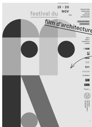
Affiche du FFA 22 © Philippe Tytgat

Depuis 2006, notre association a pour objet la diffusion et la médiation de la culture architecturale, de l'urbanisme et du paysage. Nos actions sont aussi variées que les supports et notre imagination le permettent, et notre mobilisation rend accessibles à tous les publics des projets enrichissants et décroissant. En soutenant la Maison de l'architecture de Lorraine, chaque adhérent contribue à la valorisation d'approches aussi artistiques que pratiques, aussi pédagogiques que divertissantes.