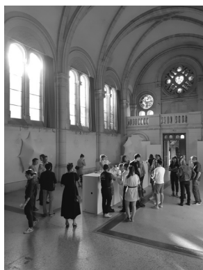
Exposition ex)tensions de Birgit Mollemer, 2022, coproduction école de Condé / Maison de l'architecture de Lorraine

Démonstratives, illustratives ou artistiques, les expositions sont l'occasion d'explorer les nombreuses facettes de la culture architecturale. Maquettes, photographies, œuvres plastiques, installations, etc. témoignent des convergences créatives entre les disciplines et entre les sensibilités. Entre 2021 et 2022, la Maison de l'architecture de Lorraine a notamment participé à l'itinérance de l'exposition Frugalité créative en Allemagne et dans le Grand Est. Et chaque année, elle est co-organisatrice et co-commissaire de projets artistiques avec l'école de Condé, les villes de Metz et Nancy, des musées.