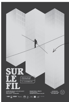
Affiche du FFA 210 © Philippe Tytgat